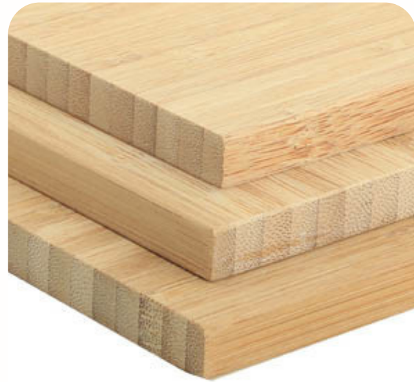
Placa de bamboo 244 x 122cm (7mm)