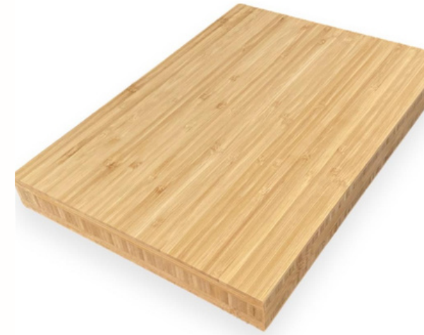
Placa de bamboo 244 x 122cm (20mm - Vertical)