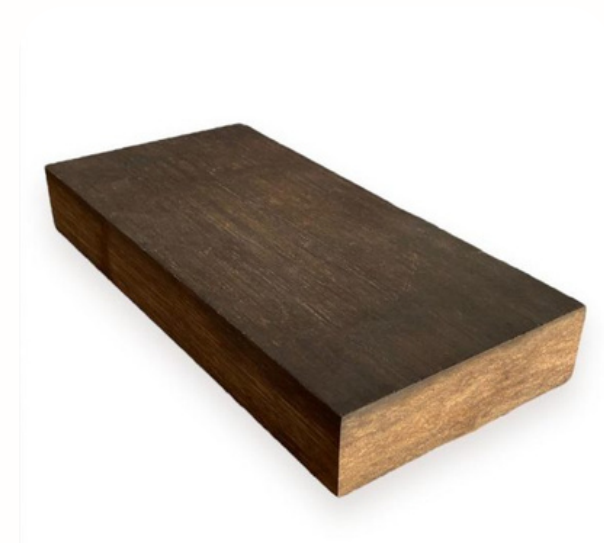
Placa Bamboo Density