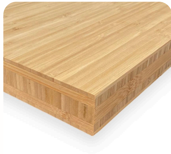
Placa de bamboo 244 x 122cm (40mm)