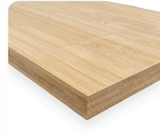
Placa de bamboo 244 x 122cm (30mm)