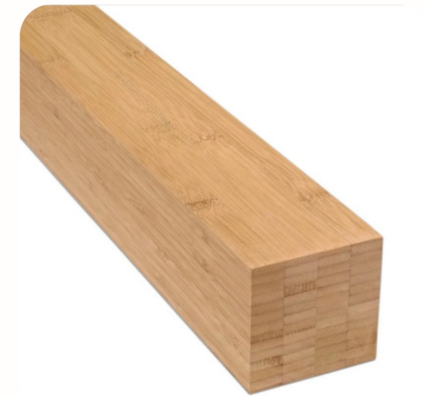
Listón de Bamboo