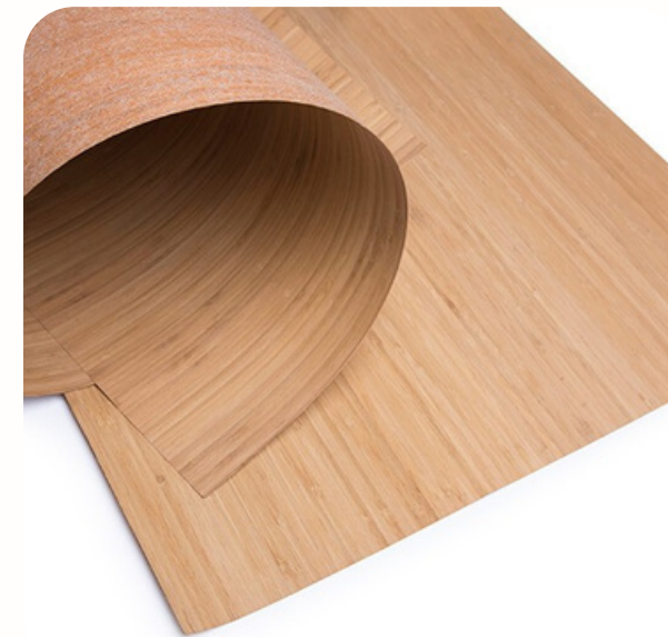
Lámina de bambú