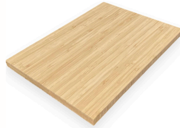
Placa de bamboo 244 x 122cm (20mm)